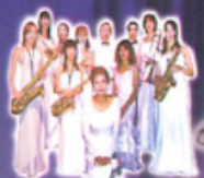
サンドラ&クイーンズ